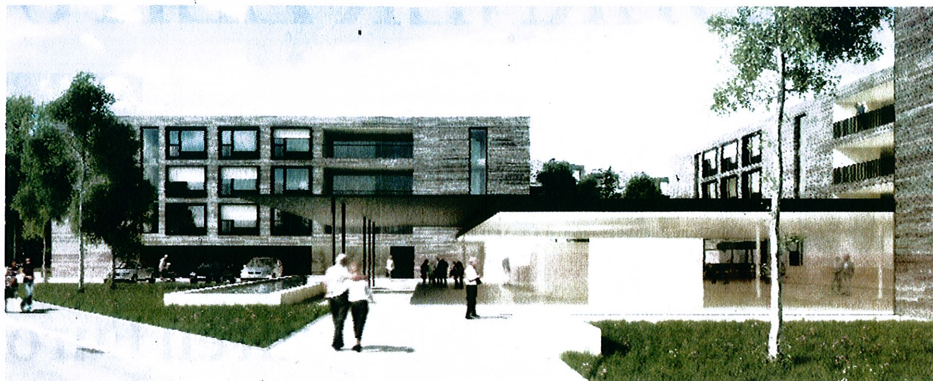
So könnte das Alterszentrum Haslibrunnen dereinst aussehen: Visualisierung des Siegerprojekts «Rosalind 3» unter der Leitung des Architekturbüros Ducksch & Anliker.

Das Projekt sieht anstelle des heutigen Alterszentrums einen Neubau mit drei Wohnhäusern und einem zentralen, verschiedenartig nutzbaren Verbindungsbau vor. Die viergeschossigen Wohnhäuser sollen wie die Flügel eines Windrades um den eingeschossigen Zentralbau herum angelegt werden. Der Haupt-